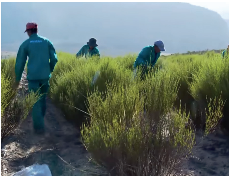
Travailleurs dans une plantation de rooibos.

Les travailleur-euse-s ont bénéficié mensuellement de bons d'achat destinés à l'achat de produits alimentaires de base, d'articles d'hygiène et de produits de nettoyage. Plusieurs membres ont également reçu tous les mois une allocation en espèces calculé en fonction du nombre de jours travaillés pour les aider à subvenir aux besoins domestiques.