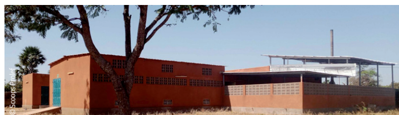
Unité de transformation de la cajou.

Afin de favoriser la participation des femmes au sein de la coopérative, les frais d'adhésion des femmes et des jeunes ont été réduits de moitié.