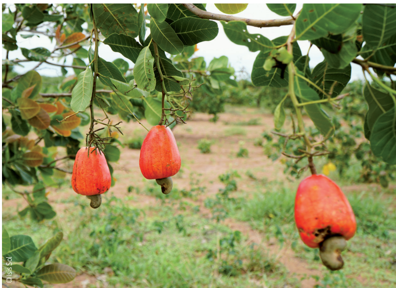
Pommes de cajou.