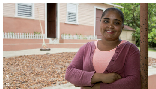
Productrice de la coopérative COOPROAGRO devant une zone de séchage des fèves de cacao.

Depuis 2018, Coopproagro, en partenariat avec des entreprises, des chercheurs, des ONG et des consommateurs, participe au projet Cacao Forest. Il s'agit d'un projet pionnier de recherche et de développement dont le but est de créer des modèles agricoles innovants qui amélioreront la qualité du cacao, augmenteront la productivité des cacaoyers et amélioreront la qualité de vie des producteur-ric-e-s tout en protégeant l'environnement.