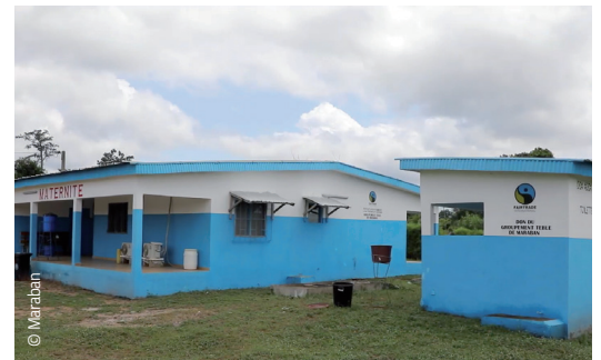
Maternité construite à Duonfla

Dans les zones rurales, l'accès aux soins peut être difficile en raison de la distance séparant les villages des centres de soins et la qualité de la voirie. Aussi, pour permettre aux femmes d'accoucher à proximité de chez elles dans de bonnes conditions, une maternité a été construite à Duonfla. Une ambulance a été achetée et donnée au centre de santé rural de Duonfla pour permettre le transport des malades.