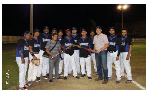
Financement de bâtons pour le club de baseball de la communauté

Outre la concurrence avec d'autres organisations, Coopabando fait face à plusieurs défis. Tout d'abord, elle subit une pression financière importante en raison de la baisse des prix de la banane et de l'augmentation des coûts de production. De plus, la hausse des coûts d'exportation et les exigences accrues en matière de qualité des fruits imposées par l'un de ses principaux clients ont contraint la coopérative à suspendre ses exportations en septembre 2023. Les bénéfices générés, après les réductions appliquées en raison de ces exigences, ne couvraient plus les coûts de production et d'exportation. Face à cette situation, Coopabando a cherché à augmenter ses ventes auprès des exportateurs locaux et à développer davantage ses activités avec eux.