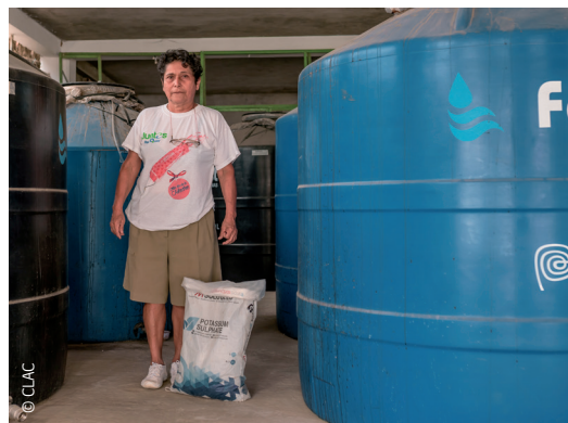
Bio-fertilisants fabriqués par l'organisation.

Des campagnes médicales sont également financées pour permettre de promouvoir auprès des membres et de la communauté une culture de prévention et de bonnes habitudes alimentaires. Apbosmam a soutenu l'implémentation et l'équipement de postes médicaux communaux.