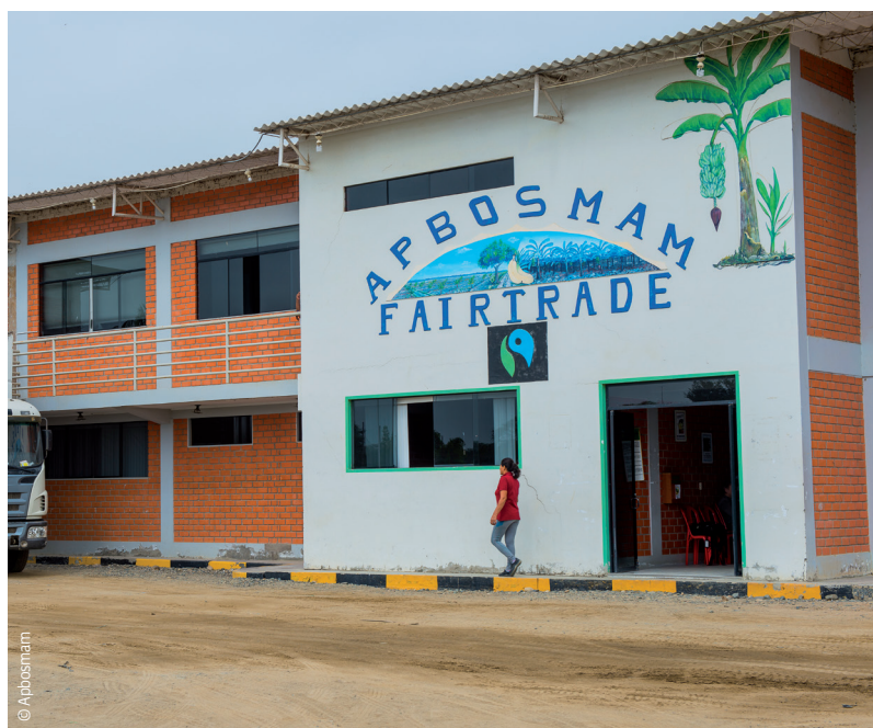
Siège de l'organisation Apbosmam.

La prime de développement a permis de financer la main d'œuvre de l'organisation, les frais administratifs, les frais de certification et l'assistance technique aux membres, nécessaires pour le bon fonctionnement de l'organisation.