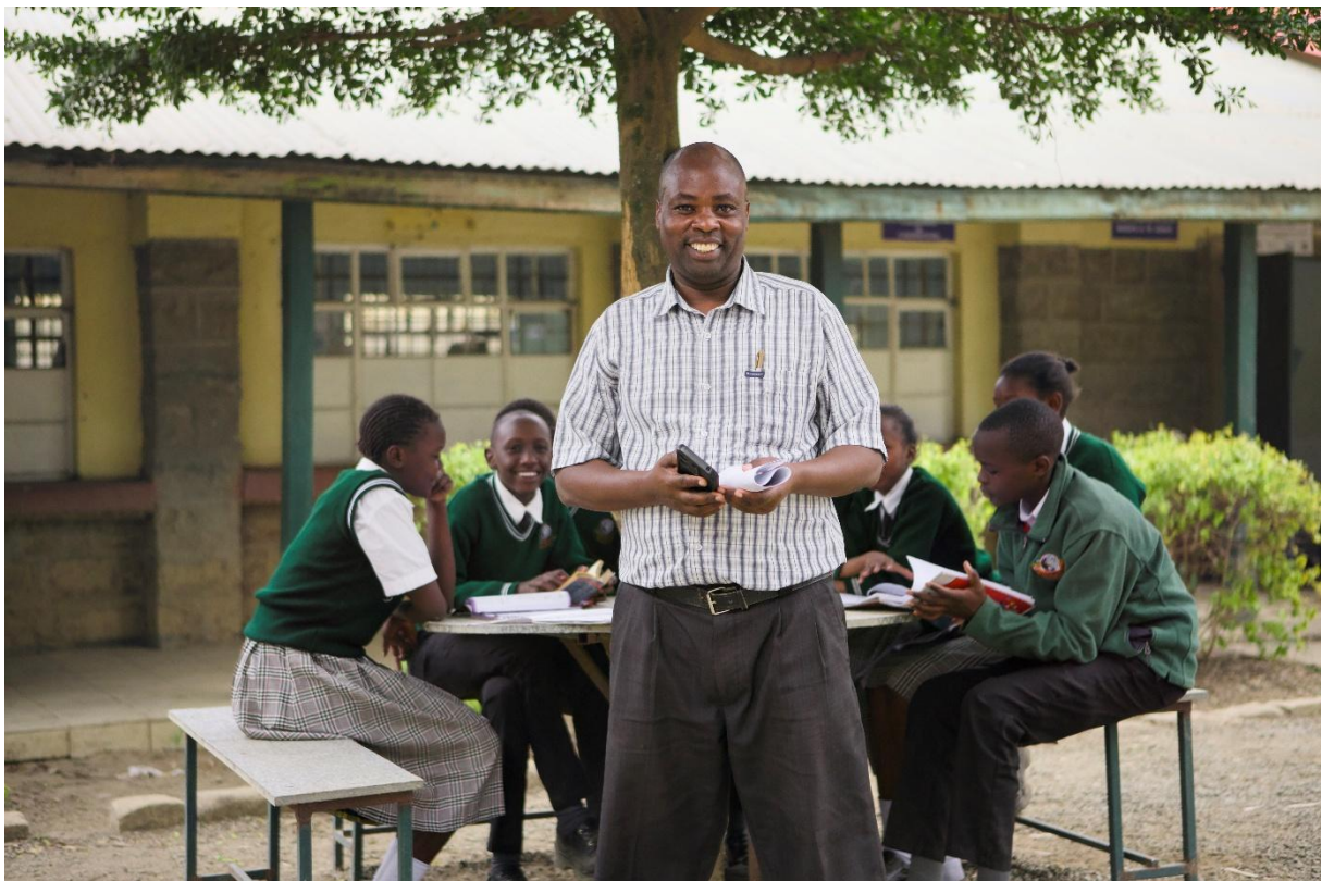
Lärare vid premiumfinansierad skola, Kenya.

När ni genomfört samtliga träffar och är klara med studiehandledningen har ni rätt till ett kursintyg. Du mejlar då in deltagarnas namn och e-post till Fairtrade via utbildning@fairtrade.se och får kursintygen skickade till din e-post.