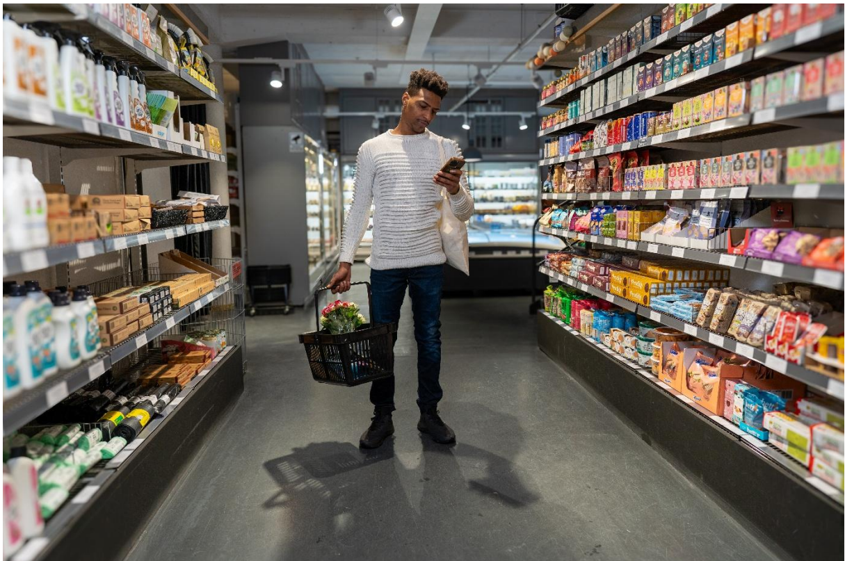
Konsument i butik, Sverige.

Låt deltagarna presentera sina resultat från undersökningen för gruppen och låt dem diskutera hur deras svar överensstämmer eller skiljer sig åt. Be dem sedan reflektera kring varför det kan finnas en prisskillnad mellan Fairtrade-märkta produkter och de billigaste alternativen. Vad möjliggör de extra kronor de betalar?