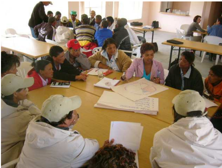
Des représentants de l'Organe Mixte en Afrique du Sud tiennent une réunion de consultation avec des membres de la communauté sur l'utilisation de la prime du Commerce Équitable.

Ce document peut être utile pour les catégories de personnes suivantes : membres de l'Organe Mixte, responsables ou représentants des travailleurs dans une organisation dépendant d'une main d'œuvre salariée, certifiée ou sollicitant une certification de commerce équitable. Ce document vise à vous aider à comprendre la section 2 des standards génériques du commerce équitable pour les entreprises dépendant d'une main d'œuvre salariée. Il vous sera utile de vous référer à une copie de ces standards lors de votre lecture de ce document.